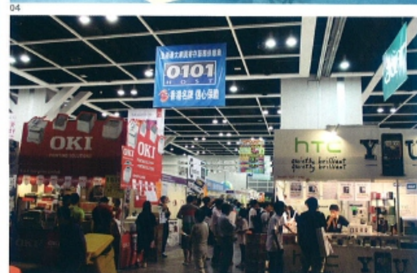
04 0101HOST的專櫃份外搶眼。 05 透過參與展覽會，品牌形象深入民心。

市場調研機構IDC及Gartner的趨勢報告指出，不論是研究機構還是各大設備供應商，都將雲端運算和雲端服務視為今年的大熱技術。其中Gartner表示，2010年全球雲端服務營收達683億美元（折合約5,000多億港元），未來相關產業將持續強勁增長，到2014年全球營收將達1,488億美元（折合約1萬多億港元），商機潛力驚人。