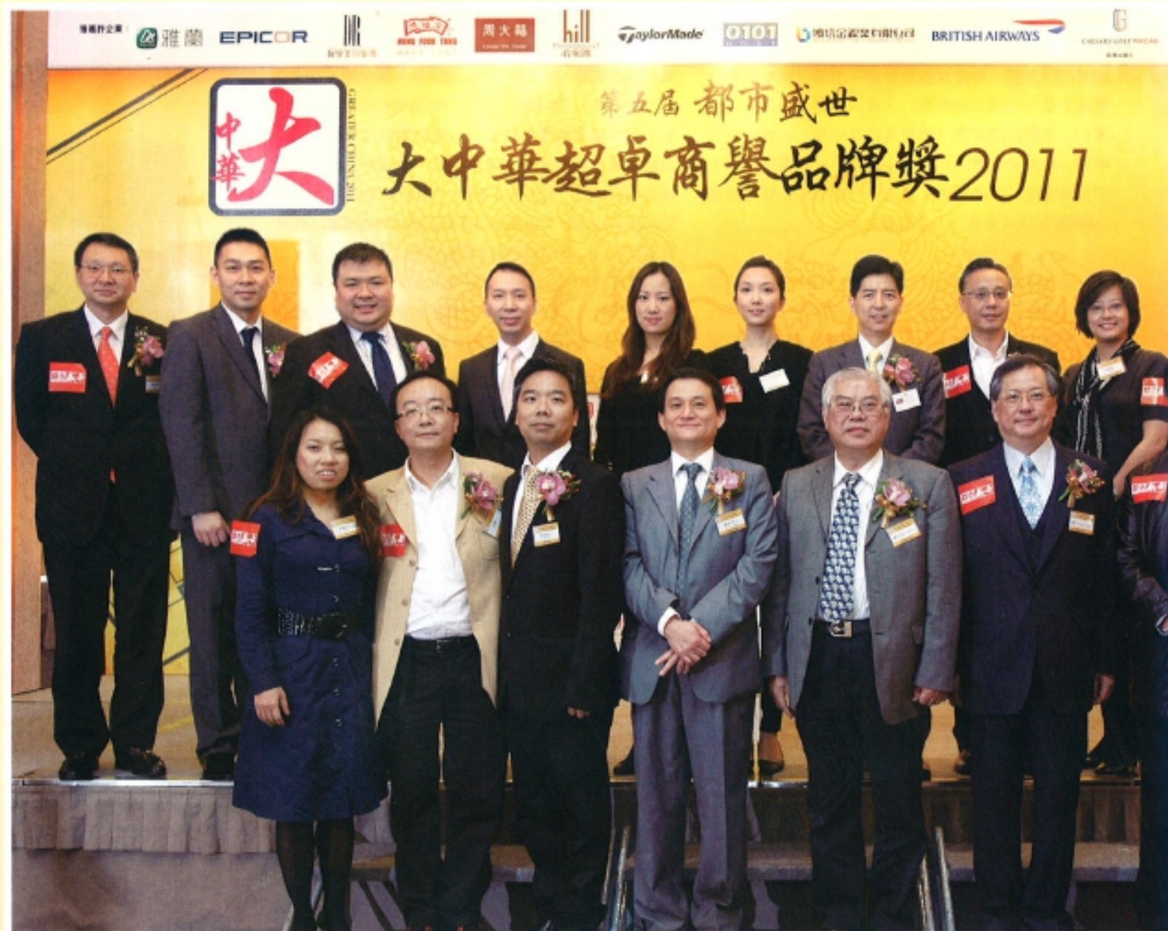
獲獎企業與主禮及開幕嘉賓們合照。