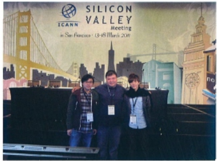
05 3月出席美國三藩市ICANN會議現場實況。

熱爆網絡界的社交網站FACEBOOK創辦人朱克伯格，其網站取得成功後便輟學，麥卓華成功後卻堅持讀完港大的工商管理課程。畢業後，曾幫助一間美容公司設置網站，自言不習慣缺少自由度的工作環境，始終認為創業才是最適合的道路。於是在2002年，創立0101HOST品牌，提供網頁寄存服務。